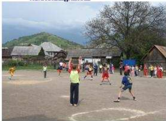
Finanțat din Fondul de Mediu