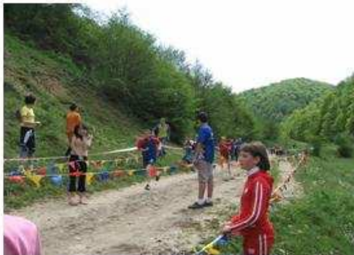
și concursuri pentru elevii cros, minifotbal, ștafetă